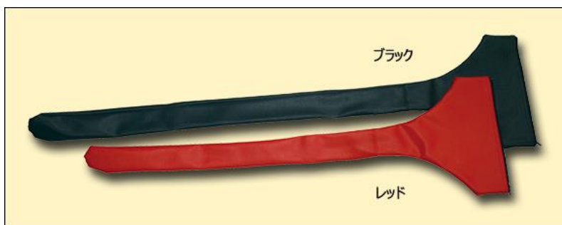
㉓ T型レザーケース (在庫限り)

[レッド : 80cm / 85cm / 90cm , ブラック : 90cm / 95cm / 100cm]