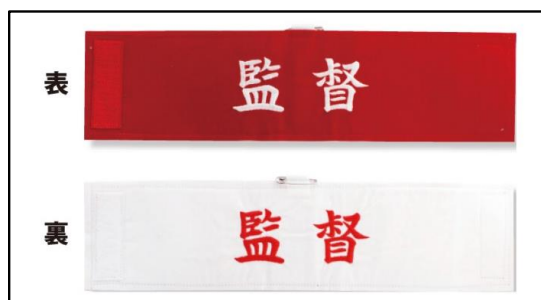
㉕ 監督用腕章 (布)