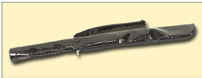
㉑ 2P型エナメルケース (在庫限り)